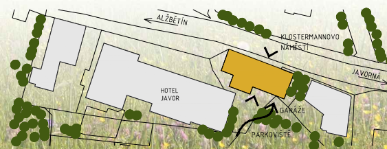
Situační plán lokality