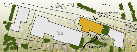
Situční plán lokality